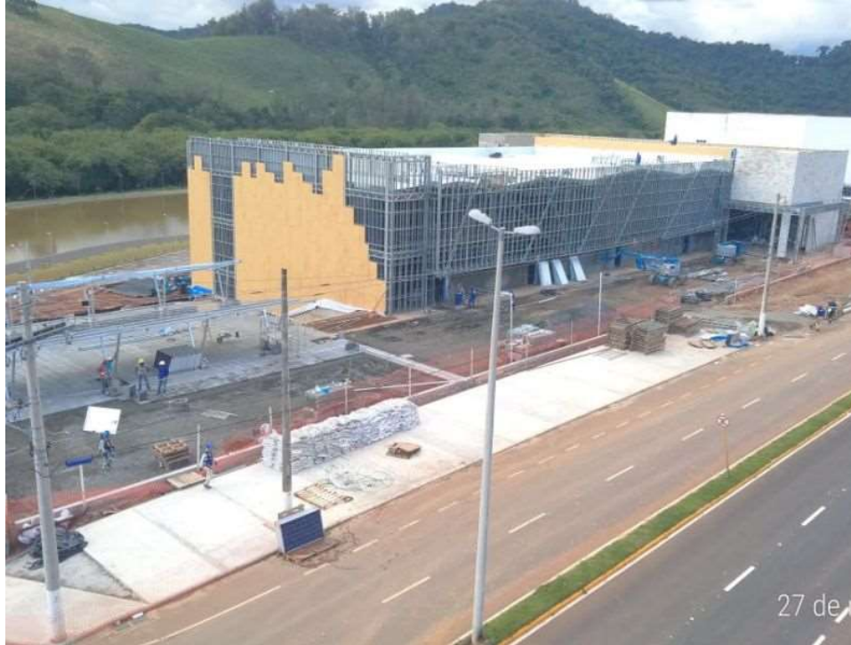
Figura 2 - Estrutura em Light Steel Framing - Cinema Itajubá - MG