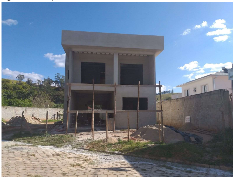
Figura 1 - Construção em alvenaria

Segundo Araújo et al (2014) o método de concreto armado tem sua maior popularidade, devido a durabilidade e custo mais viável, pois sua junção de aço e concreto tem resistência suficiente aos esforços submetidos.