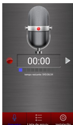
Figura 03 – Aplicativo de celular “Gravador de Som”