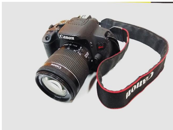
Figura 02 – Câmera Canon dslr t5i com lente 18 55mm