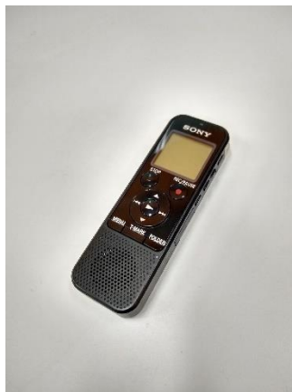
Figura 01 – Gravador ic record da Sony modelo ICDPX440