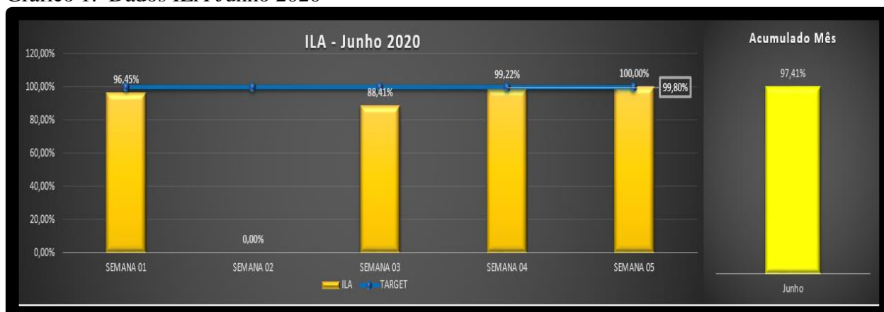
Gráfico 1. Dados ILA Junho 2020

Conforme cronograma o primeiro mês de implementação teve início em junho de 2020, abaixo a tabela demonstra um número alto de divergências, que eram esperados. Neste início o foco total concentrou-se nas análises das divergências e definição de ações para evitar impactos nos clientes finais.