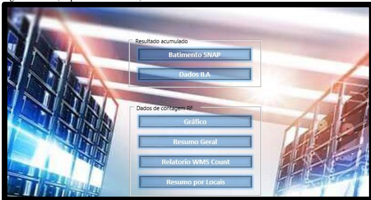
Figura 2. KPI (Report Excel mensal)

Na terceira etapa definiu-se os relatórios a serem divulgados mensalmente após o término de cada ciclo, e a oscilação nos resultados passou a ser tratada pontualmente entre os responsáveis pela empresa e o 3pl através de reuniões, onde são discutidos os resultados e definem-se ações para os erros identificados.