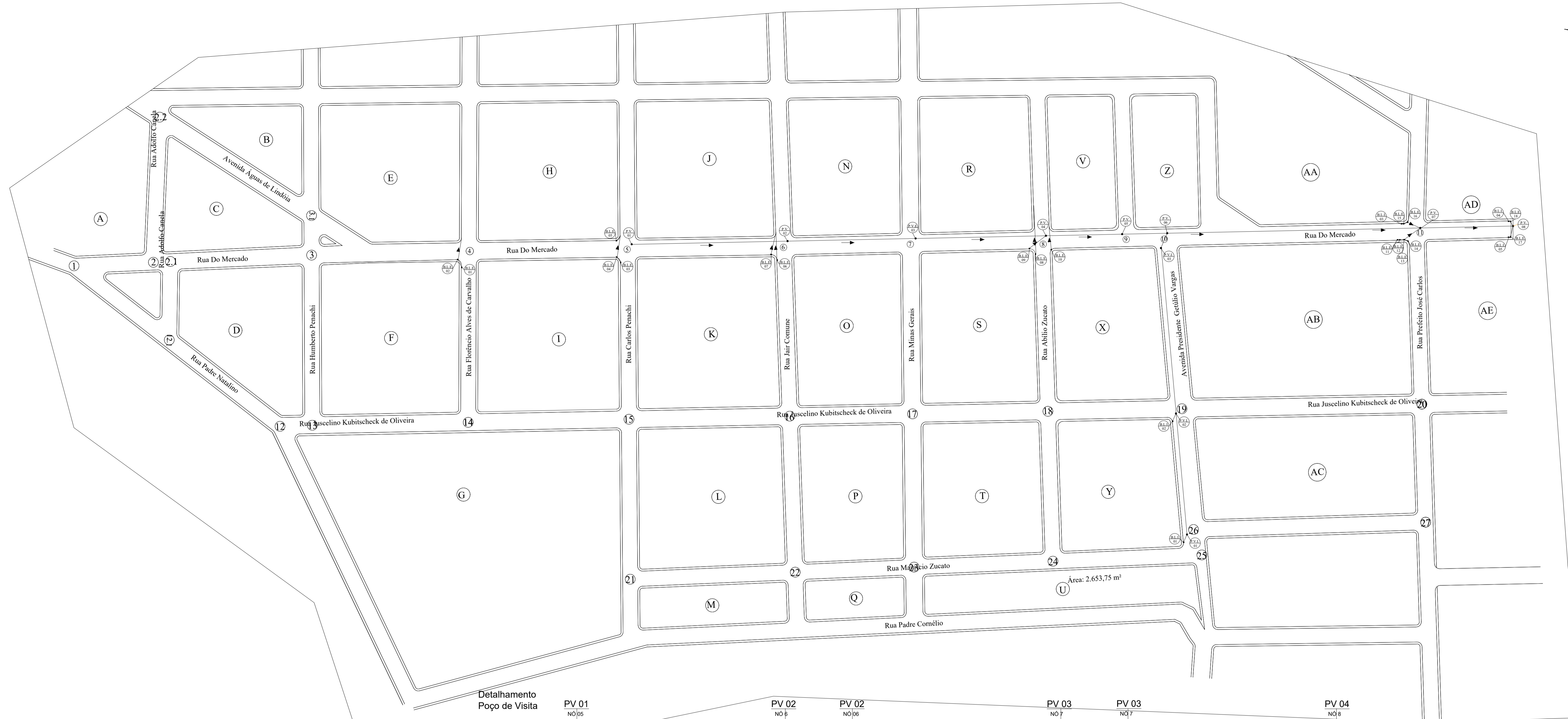
Detalhamento Poço de Visita