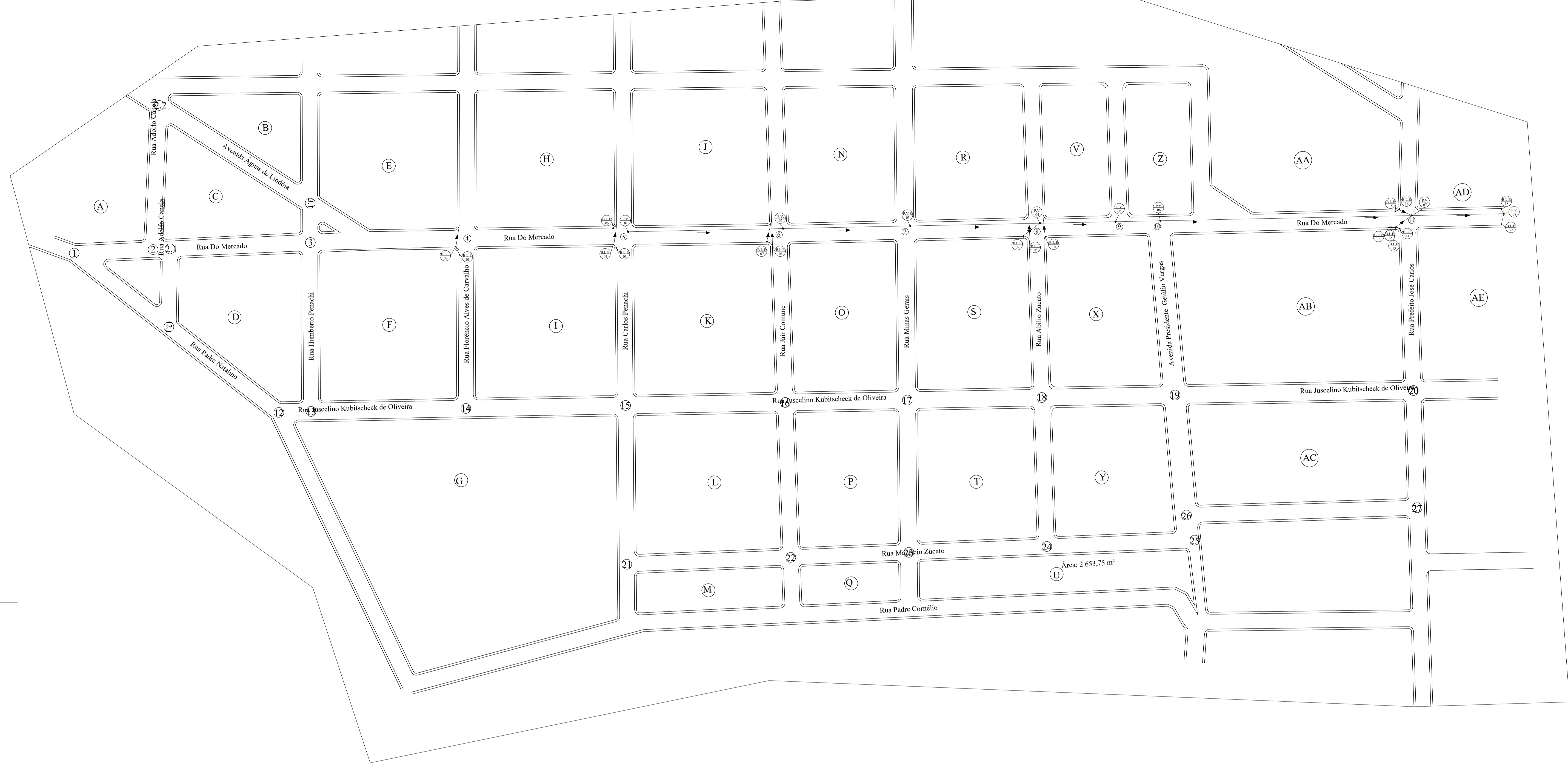
Detalhamento Boca de lobo