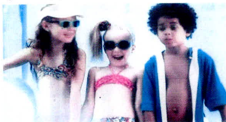
Figura 20 – Propaganda da Brandili direcionada aos pais.