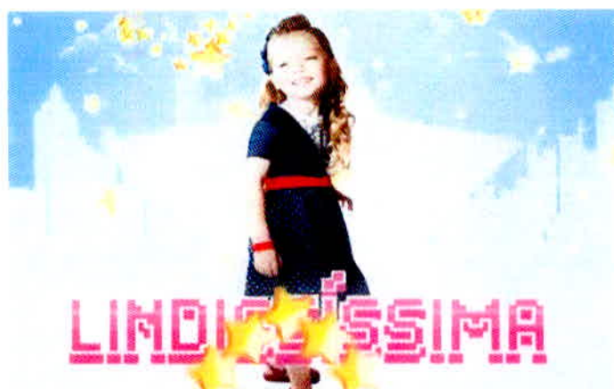
Figura 15 – Propaganda Brandili com animações.