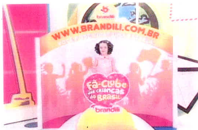
Figura 12 – Merchandising da Brandili com a apresentadora mirim Maísa.