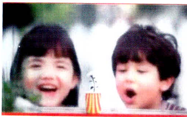
Figura 7 – Danoninho pra plantar.