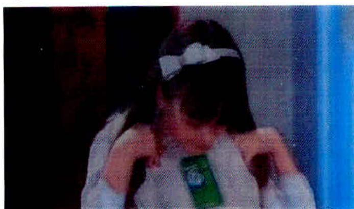
Figura 13 – Merchandising na novela Carrossel do SBT.