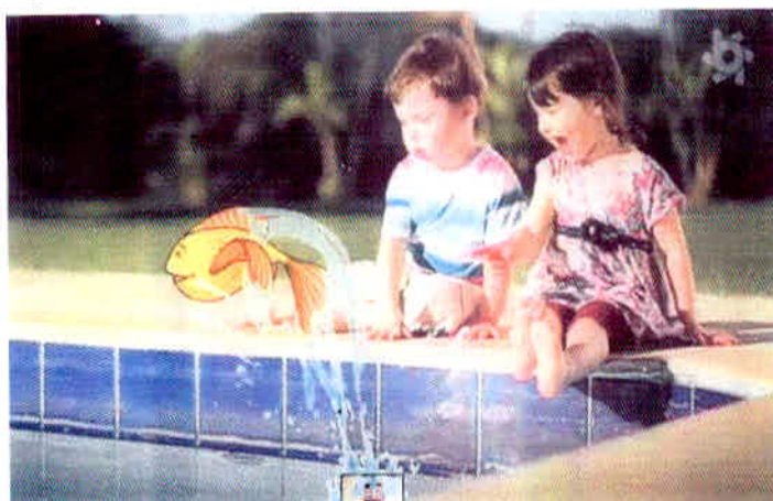
Figura 16 – Propaganda Brandili com incentivo à imaginação