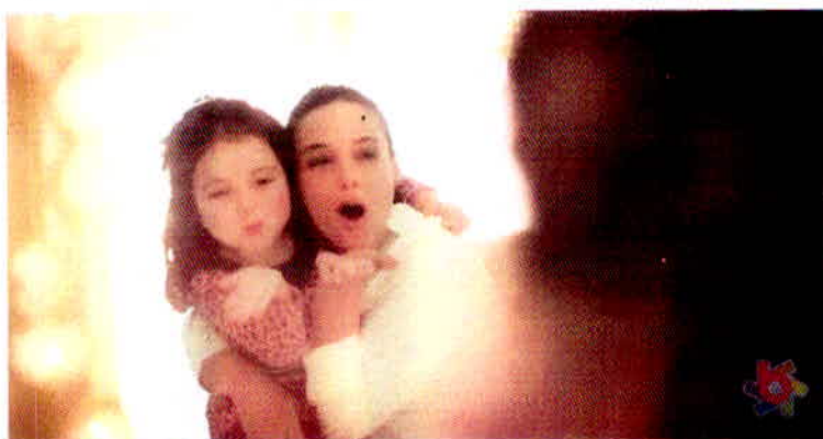
Figura 19 – Mãe e filha em peça da Brandili.