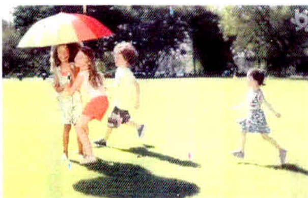
Figura 11 – Propaganda da Brandili para o público infantil.