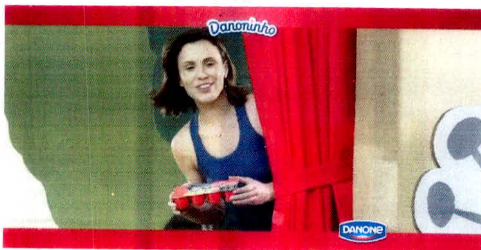
Figura 3 – A Representação dos pais na propaganda da Danoninho.