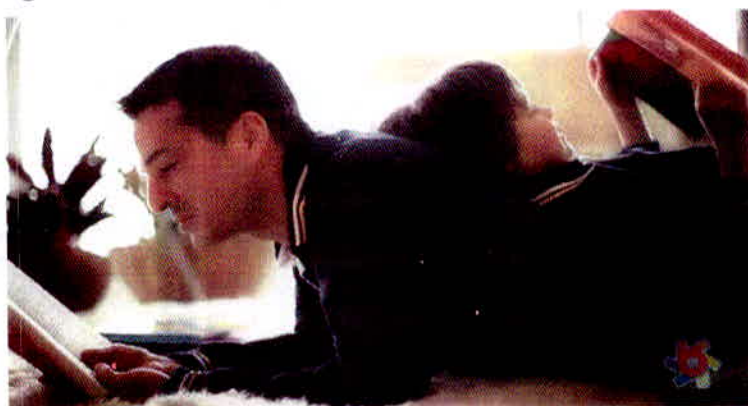
Figura 18 – Pai e filho em peça da Brandili.