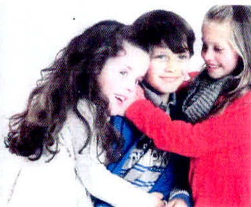
Figura 10 – Propaganda de televisão da Brandili.