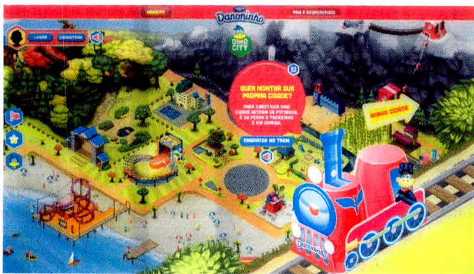
Figura 9 – Site da Danoninho.