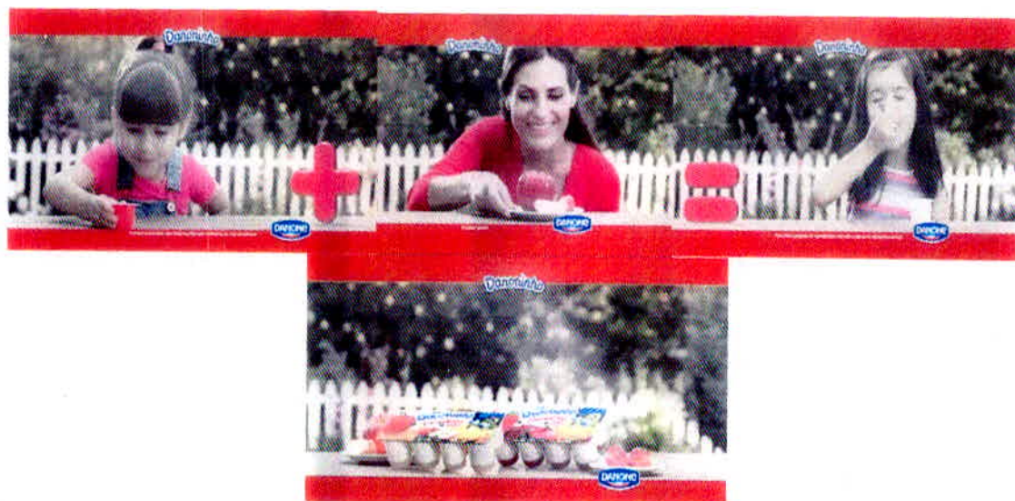
Figura 5 – Propaganda com foco no valor nutricional do Danoninho.