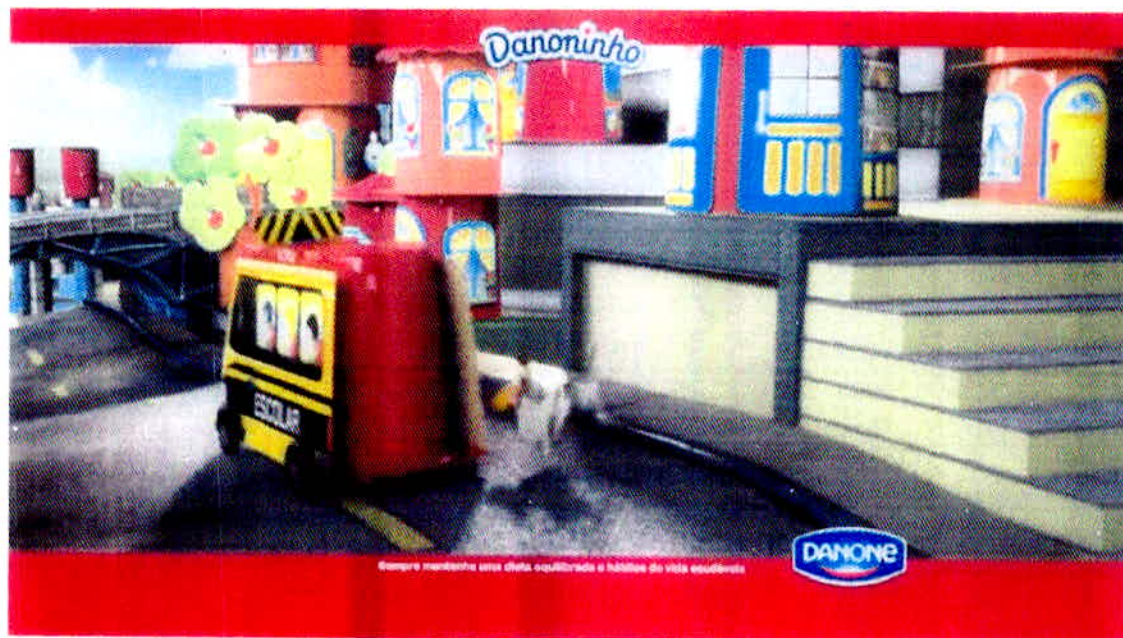
Figura 8 – A cidade do Dino.