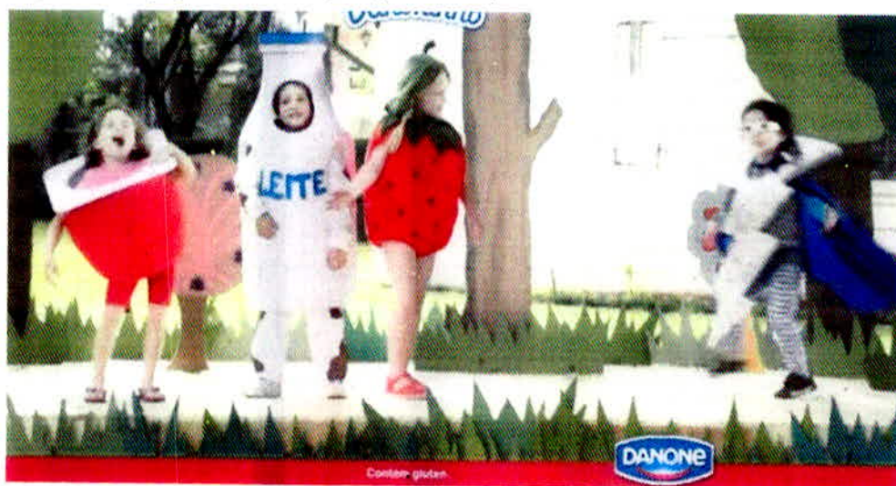
Figura 1 – Propaganda Danoninho para pais e crianças.