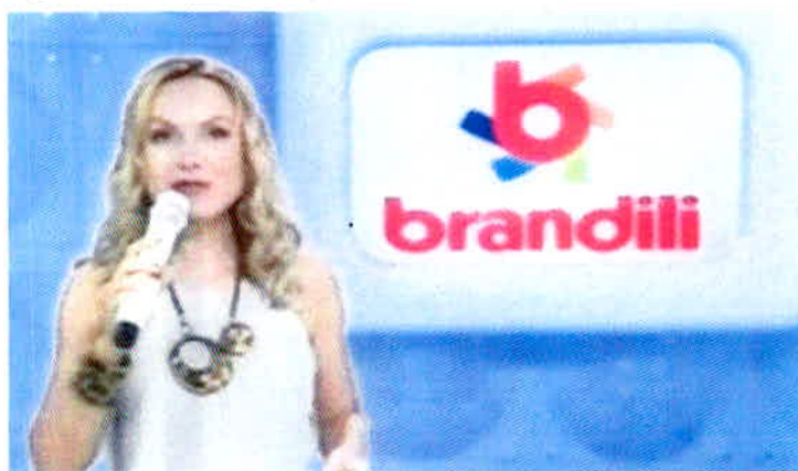
Figura 17 – Merchandising da Brandili com a apresentadora Eliana.