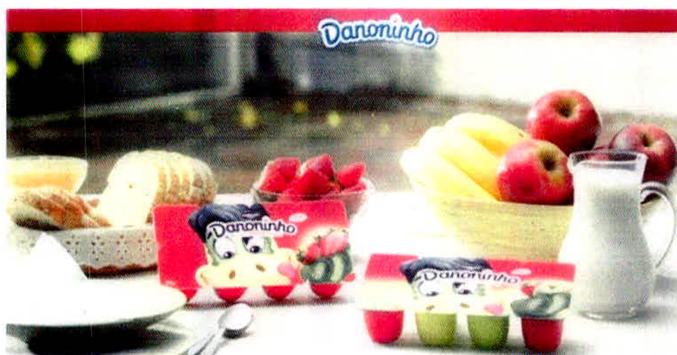
Figura 4 – Incentivo à boa qualidade da alimentação.