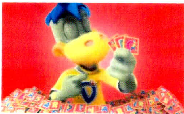
Figura 6 – Dinoletras.