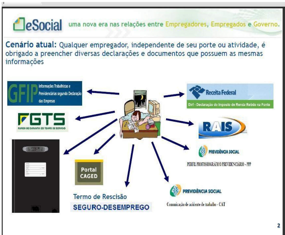
Figura 2 – Obrigações acessórias atuais a serem unificadas

devem ser expressos do modo mais simples e transparente possível, para facilitar a sua compreensão por parte dos empregados”.