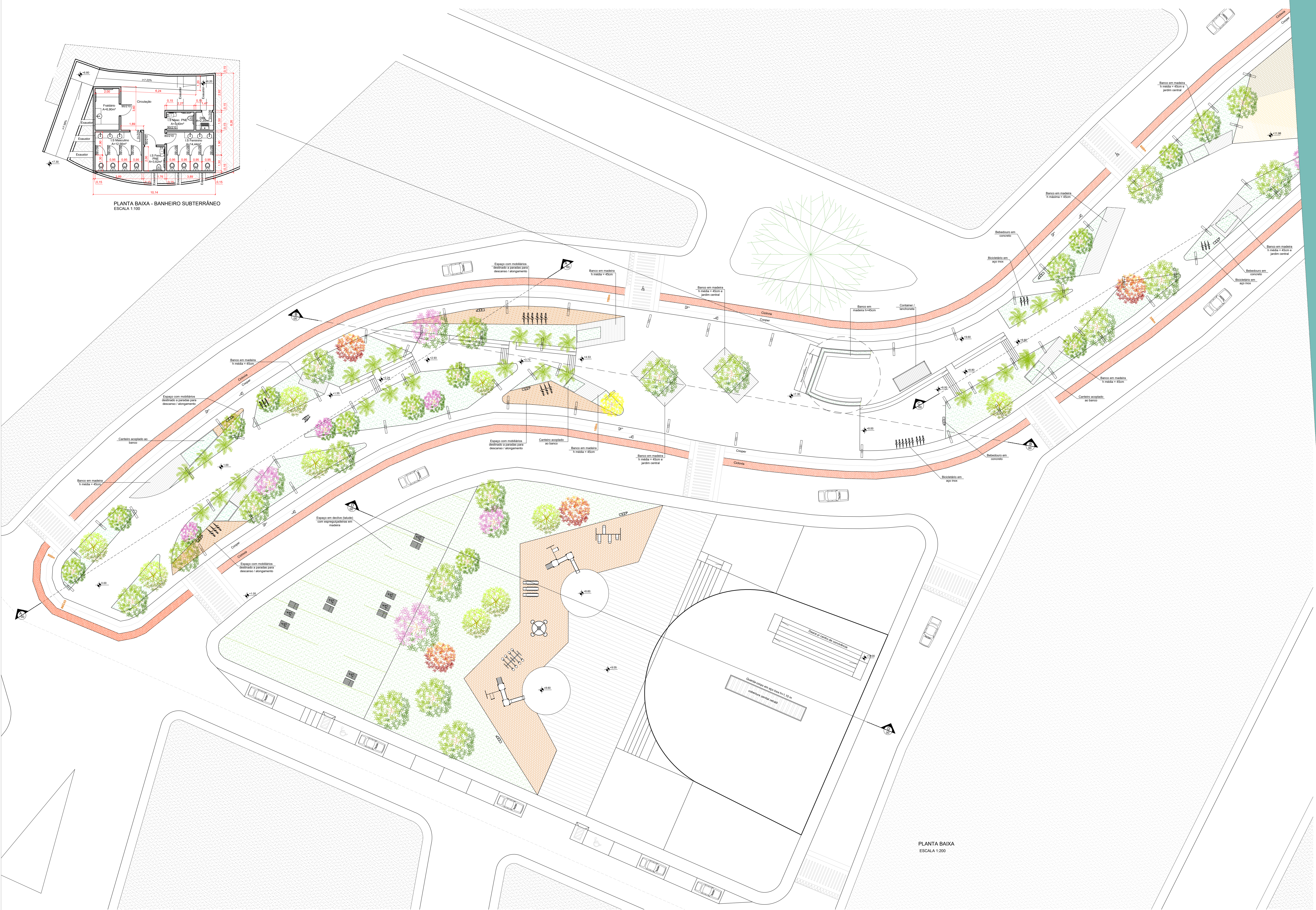
PLANTA BAIXA ESCALA 1:200