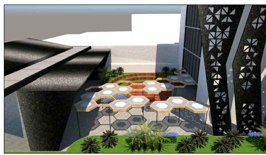
05 ÁREA DE EXPOSIÇÕES E PALESTRAS AO AR LIVRE 3D ESCALA: SEM ESCALA