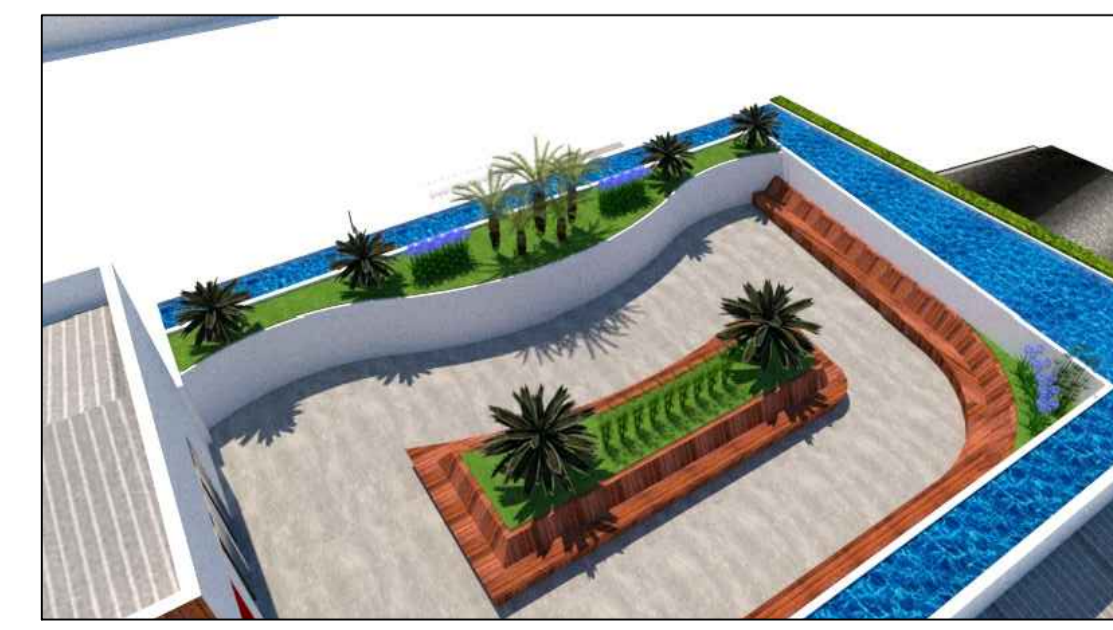
06 TERRAÇO - ÁREA DE CONVIVÊNCIA 3D ESCALA: SEM ESCALA