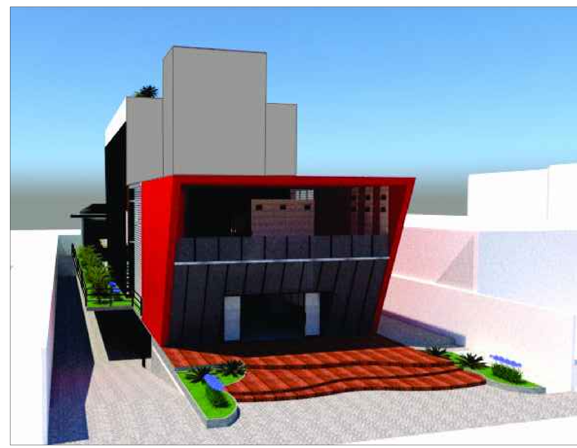
03 FACHADA PRINCIPAL 3D ESCALA: SEM ESCALA