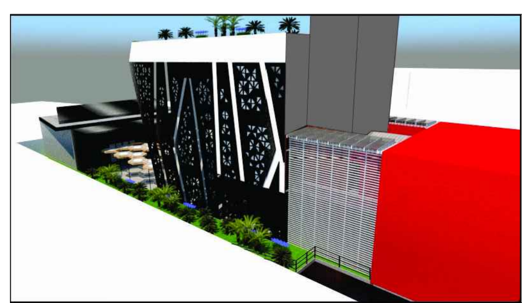
04 FACHADA LATERAL 3D ESCALA: SEM ESCALA