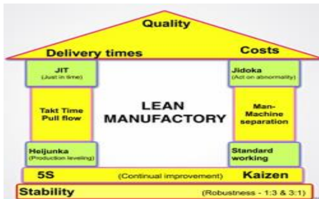
Figura 01: Pilares do Sistema Lean Manufacturing .

O sistema Lean Manufacturing é uma técnica que busca eliminar desperdícios na cadeia produtiva e otimizar processos continuamente, abaixo podemos visualizar o pilar do sistema.