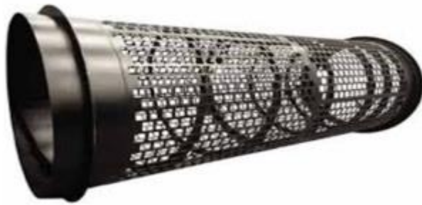
Figura 02: Novo Tambor especificado

Como não é possível fabricar esse tambor na unidade devido à falta de ferramentas e equipamentos específicos, contratou-se uma pequena empresa de metalurgia que desenvolverá o novo tambor conforme cálculos e especificações definidos, o novo tambor deverá ficar conforme imagem abaixo: