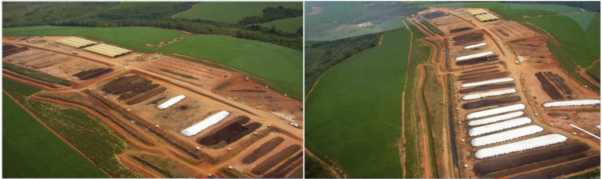
Foto 01: Área onde Iniciou a Usina de Compostagem visão das Pilhas ou Leiras