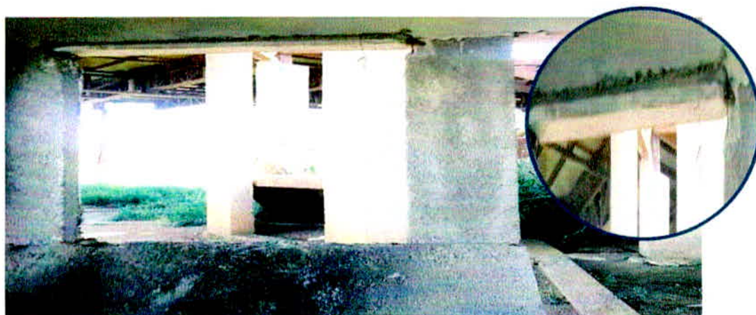
Figura 5 - Ausência de adensamento e ferragem exposta

A norma de execução de concreto armado NBR 14931:2004 prevê que “O adensamento deve ser cuidadoso para que o concreto preencha todos os recantos das fôrmas.”.