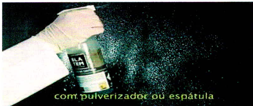
Figura 11 - Aplicação do produto com pulverizador