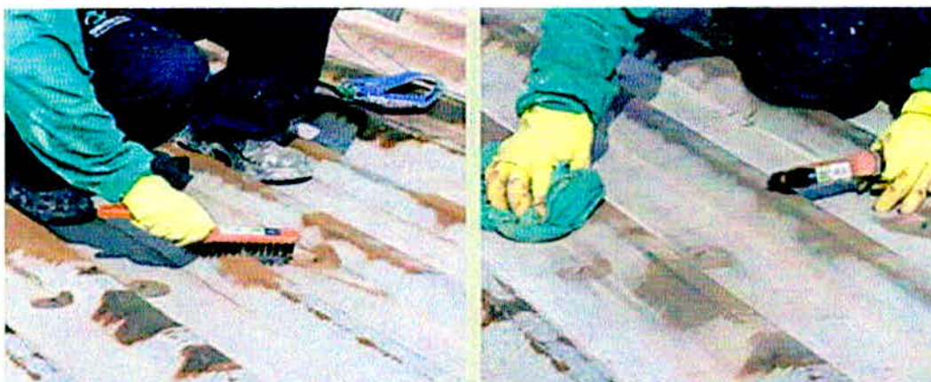
Figura 10 - Retirada de sujeiras e corrosão soltas

Consiste em passar uma escova para retirada desses materiais que possam estar na estrutura.