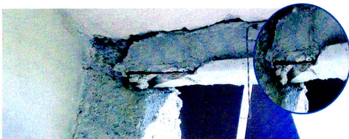
Figura 7 - Exposição da armadura por ausência de cobrimento e adensamento adequado

A armadura conforme a NBR 6118/2014 deve estar protegida com o concreto, de forma a respeitar o cobrimento demonstrado nas condições expostas na norma, conforme anexo 01.