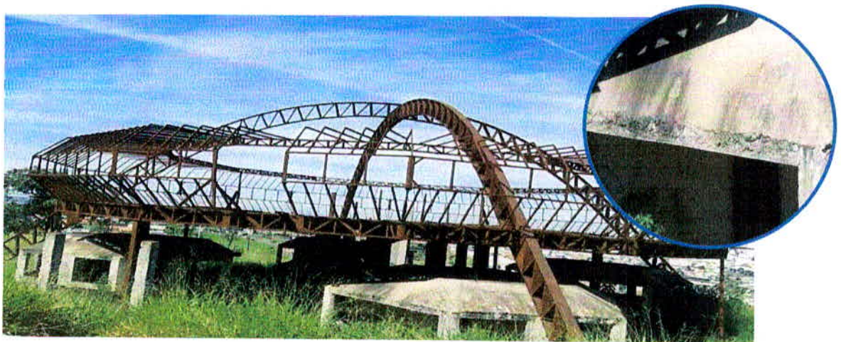
Figura 1 - Corrosão uniforme na estrutura metálica e concreto contaminado pela corrosão da estrutura metálica

Considerando as etapas relacionadas à inspeção detalhada, foi realizada a visita in loco na estrutura, objeto de estudo acerca da corrosão. E consequências, das etapas desse tipo de inspeção, foram retratadas por registros fotográficos citados abaixo com as devidas observações.