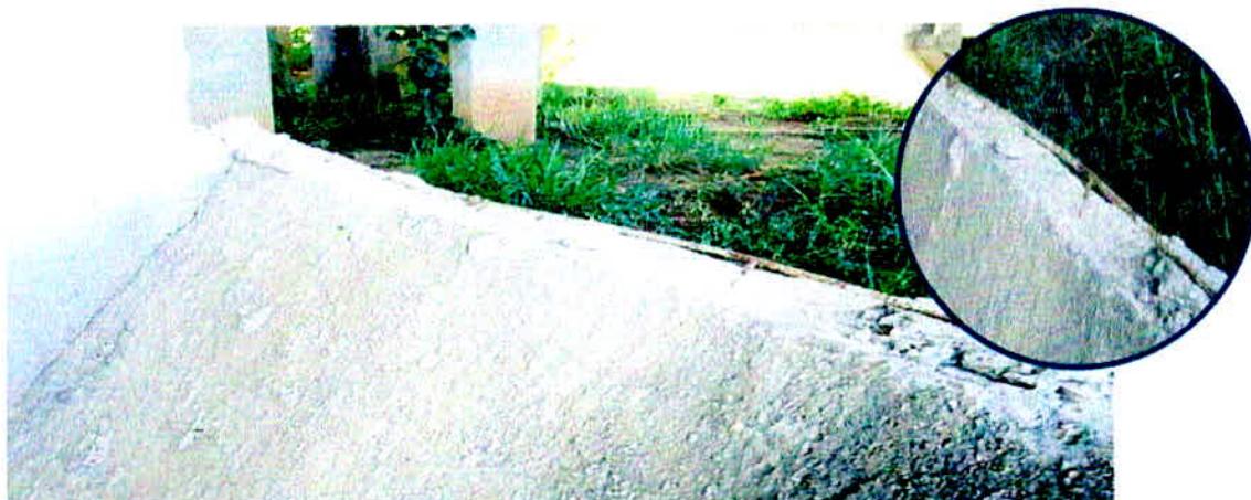
Figura 6 - Exposição de armadura e cobrimento inadequado

A armadura conforme a NBR 6118/2014 deve estar protegida com o concreto, de forma a respeitar o cobrimento demonstrado nas condições expostas na norma, conforme anexo 01.