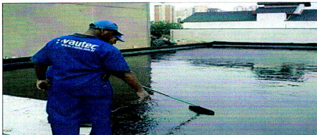
Figura 12 - Aplicação do impermeabilizante

Quando aplicado em estruturas metálicas expostas, poderá ser usado apenas como base anticorrosiva para pintura de acabamento.