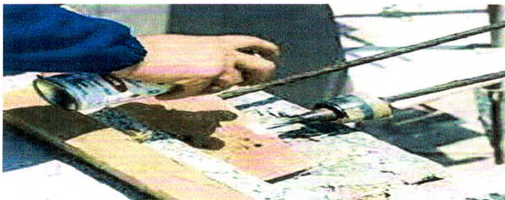
Figura 16 - Utilização de impermeabilizantes

Para as armaduras de concreto armado, permanece a informação que já foi computado juntamente com o cálculo de impermeabilizante da estrutura metálica, considerando que houve acréscimo de 5% no cálculo, visto as perdas e mesmo essas poucas armaduras do concreto armado que deverão ser tratadas.