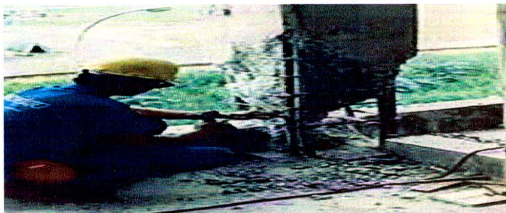
Figura 14 - Retirada de concreto danificado

Assim, conhecidas as áreas afetadas, parte-se pelo processo de retirada do concreto danificado.