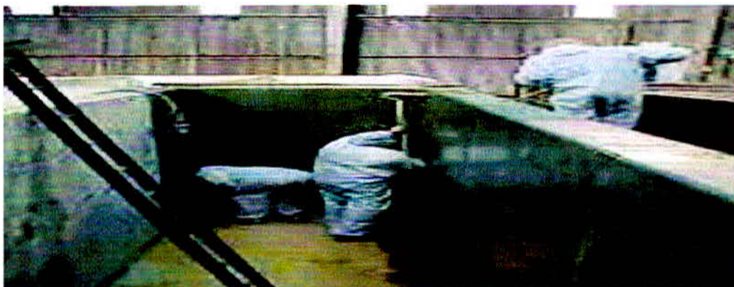
Figura 13 - Aplicação tinta epóxi anticorrosiva