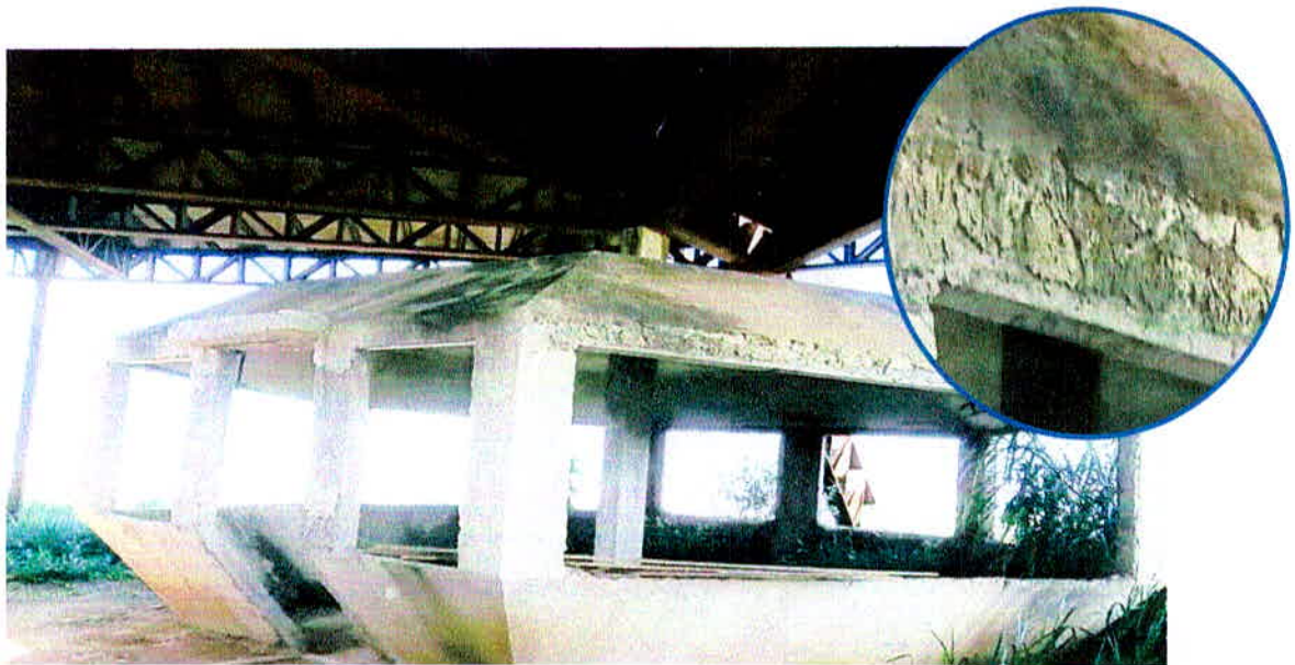
Figura 2 - Ausência de cobrimento adequado

As vigas e pilares de concreto armado foram os elementos encontrados contaminados pelo processo de corrosão e com falhas executivas. No exemplo acima, verifica-se a ineficiência quanto ao atendimento da norma NBR 6118/2014, no que tange o cobrimento das armaduras, que para esses elementos, deve respeitar o cobrimento de 30mm em correspondência a classe ambiental II que refere-se a ambiente urbano.