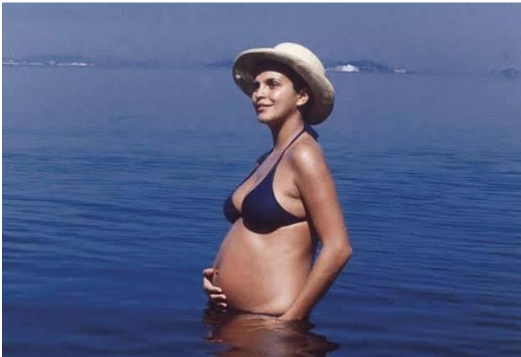
Figura 10 – Barriga de Leila Diniz provocou Revolução em 1971.