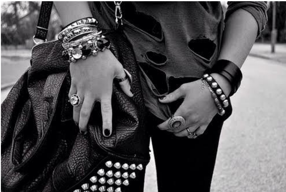
Figura 8 – Rebeldia na Moda: Uma questão de escolha.

Os grupos e tribos ao qual pertencemos têm uma influência grande com o mundo da moda, esses grupos podem expor comportamentos, estilos de vida e podem criar atitudes pessoais e elevar a autoestima pelo ato de pertencer em algum grupo.