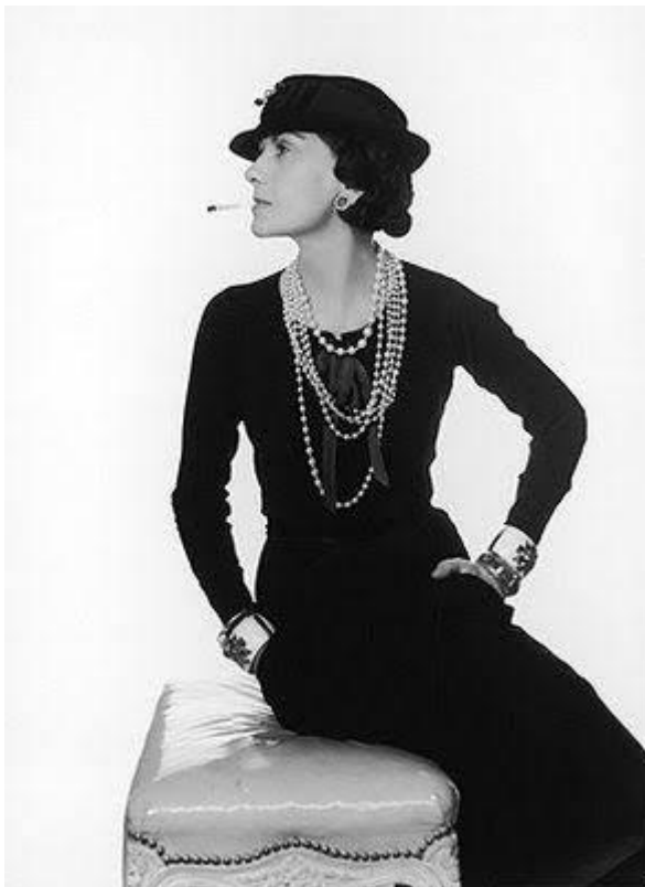
Figura 9 – Coco Chanel nascia há 131 anos.

“Uma mulher precisa de apenas duas coisas na vida: um vestido preto e um homem que a ame”. (CHANEL, 1926). Muitos não sabem como o preto surgiu neste universo, foi graças à estilista Gabrielle Bonheur Chanel que no século XX, antes usado apenas por viúvas, homens e empregadas domésticas, Coco Chanel revolucionou este conceito quando apareceu com seu famoso “vestido preto básico”, sem aplicações e flores, fazendo com que se tornasse um escândalo. ‘Agora madeimoselle Chanel quer que o mundo todo fique de luto por Boy Capel’ (MARLY, p. 275), escreveu em um jornal, pois, a criação deste vestido foi para marcar o luto do grande amor de sua vida.