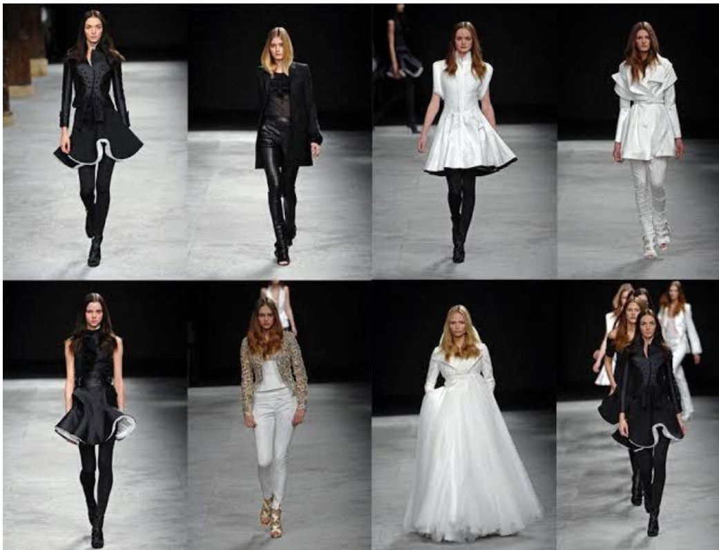
Figura 3 – Alta-Costura e Prêt-à-porter

Atualmente uma forma de representar os valores simbólicos referentes à moda, é o investimento das marcas em criações de alta costura que vão estimular as vendas das coleções de prêt-à-porter 5 . Toda uma indústria sustenta através das ideias de reinvenção e beleza que a moda tem sobre as pessoas. O consumo não é só para as necessidades, mas também para a identidade do ser humano, de quem ele quer ser para o mundo, através de suas roupas e estilo de vida.