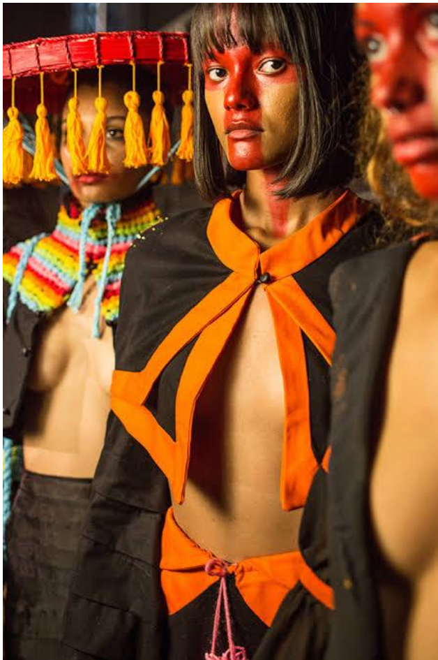
Figura 5 – A moda como uma importante e rica expressão cultural.

A maneira que foi abordado anteriormente, o ser humano usa a moda na tentativa de transformar o corpo em um veículo de discurso, para emitir sua apresentação pessoal. O nosso corpo funciona como um meio de comunicação, todos os gestos, expressões e detalhes fazem sentindo e comunica o receptor. Assim, as vestimentas que usamos transmitem informações ao nosso respeito.