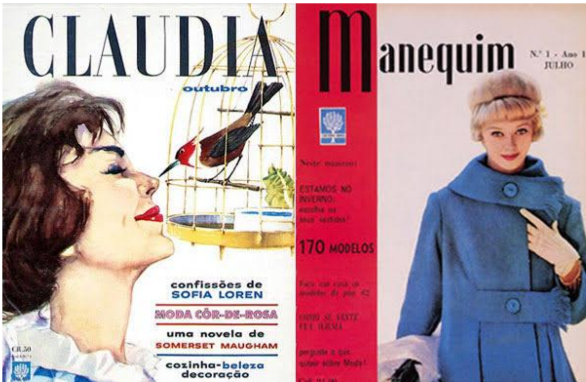
Figura 11 – As primeiras revistas de moda.