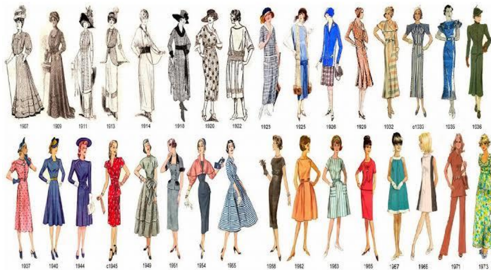
Figura 4 – A Revolução Industrial e o vestuário

Uma personagem que ainda não vimos abre as portas, entra em cena e, antes que tenha pronunciado uma palavra, o seu modo de vestir nos fala da sua condição e do seu caráter. Mas ainda do que a personagem, a roupa exprime um estado de espírito. Por meio da roupa cada um de nós trai, total ou parcialmente, a personalidade, os hábitos, os gostos, o modo de pensar, o seu humor em determinado momento, aquilo que está prestes a fazer. (CALANCA, 2008, p. 17).