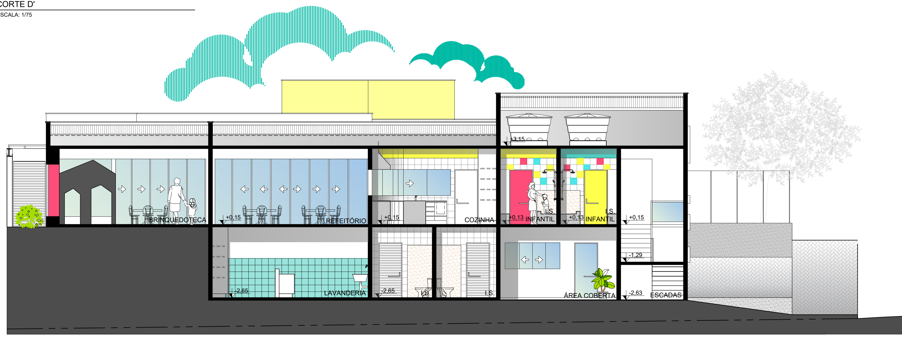
CORTE D' - HUMANIZADO ESQUEMÁTICO ESCALA: 1/75