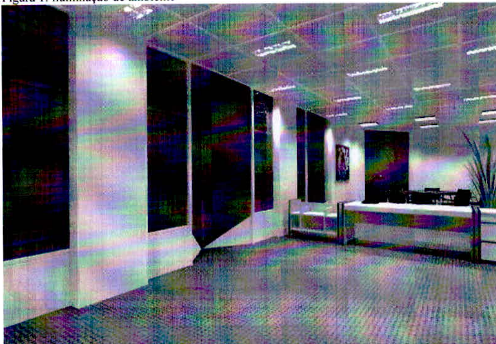
Figura 1: iluminação de ambiente