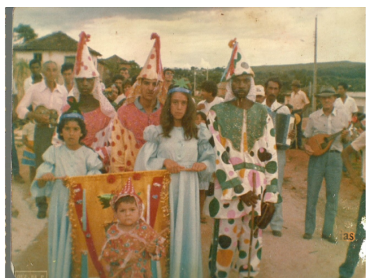
Figura 4: Folia de Reis em 1945