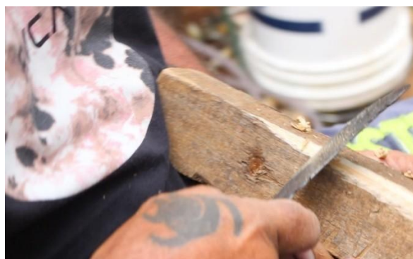
Figura 7: Artesão Dinho Corrêa, difusor do artesanato em madeira, vertente da carpintaria que é uma das primeiras profissões local que retrata a história do município.