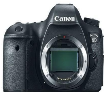
Figura 1: Câmera Canon EOS 6D.