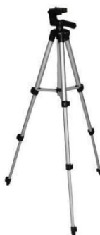
Figura 3:TripeLight Wheight SL 211

É uma lente de telefoto introduzida pela Canon no ano de 2005. É famosa por vir no kit das Câmeras Canon 5D Mark IV e na Canon EOS 6D, e também por possuir grande variação de ângulo, desde 24mm que é uma grande angular até o 105mm que já consegue aproximar bastante do objeto.