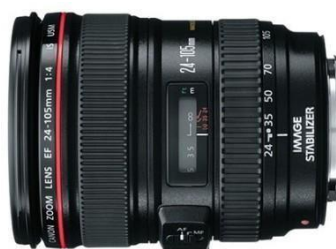
Figura 2:Lente Canon L séries 24-105 mm F/4.0