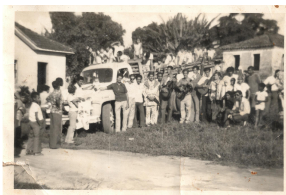
Figura 5: Folia de Reis em 1930