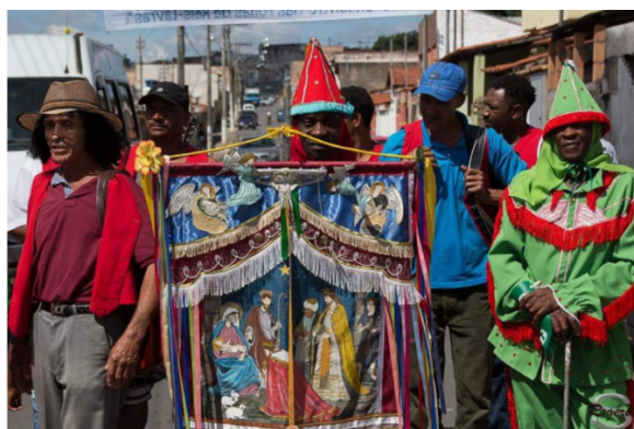
Figura 17: Companhia de Reis Estrela do Oriente, em uma de suas apresentações no mês de dezembro.