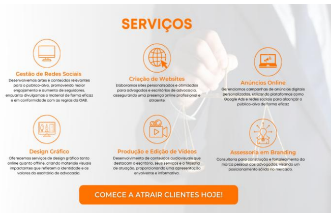
Figura 3: Serviços prestados pela empresa

Logo após a introdução da página, apresentamos de forma dinâmica uma descrição mais detalhada dos serviços que oferecemos, como: gestão de redes sociais, criação de websites, anúncios online, design gráfico, produção e edição de vídeos, e assessoria de branding. Incluímos também mais um botão com uma CTA.