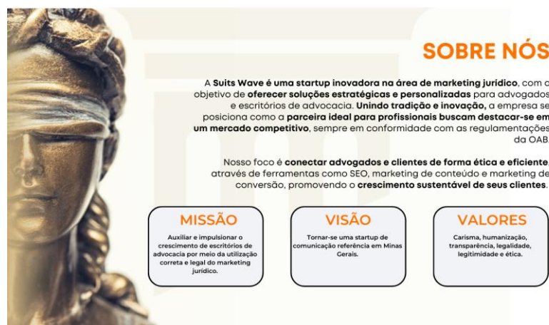
Figura 4: Sobre a startup

Uma breve explicação sobre a startup é apresentada para reforçar que nosso segmento é o marketing jurídico, destacando para o usuário nosso foco, visão, missão e valores.