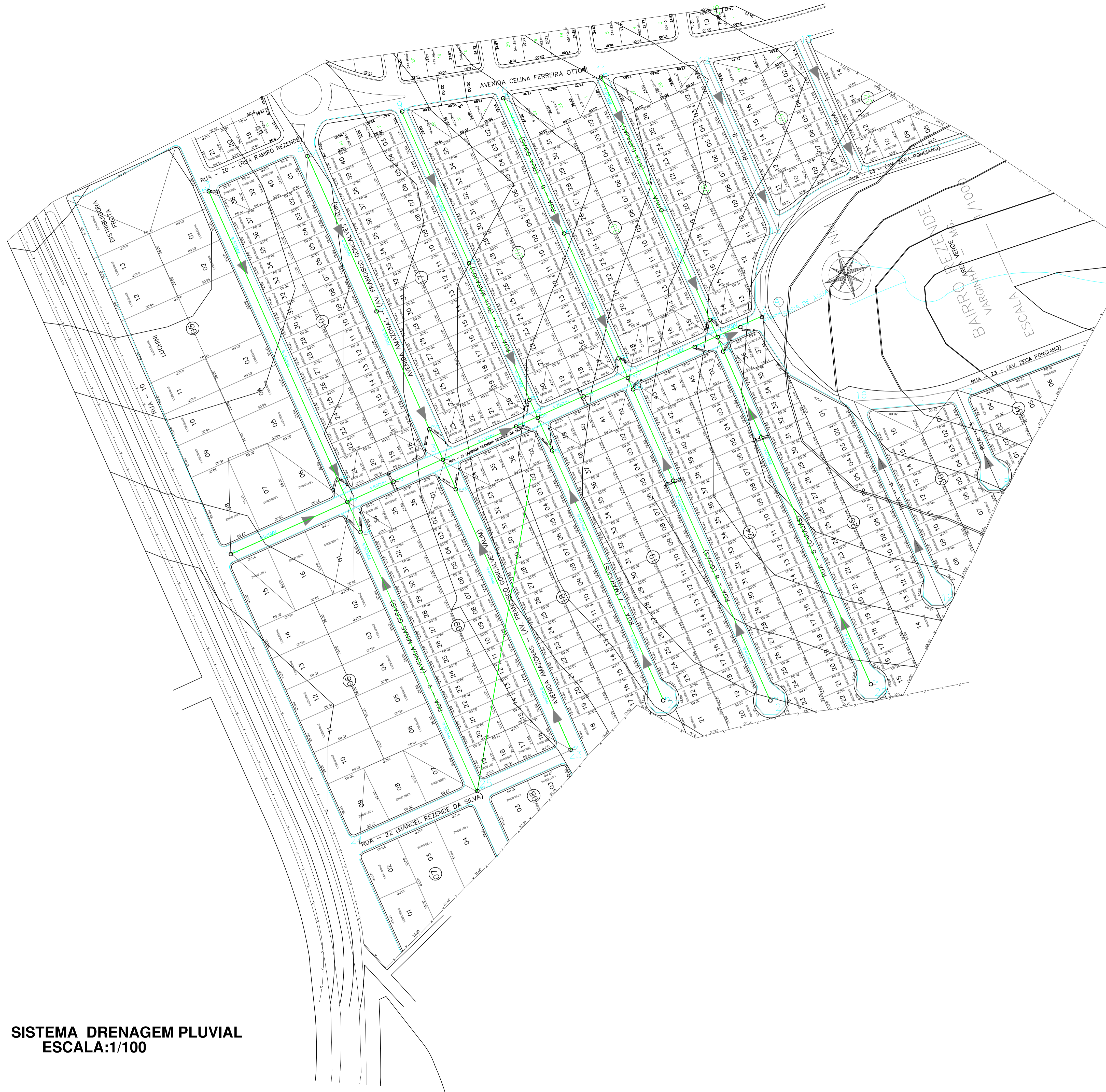
SISTEMA DRENAGEM PLUVIAL ESCALA:1/100