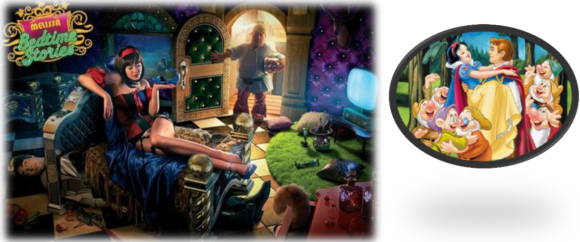
Figura 03-Peça Contos de Melissa Branca de Neve