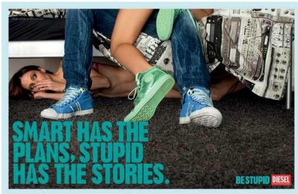
Figura 08_ Peça Diesel– Campanha “Be Stupid”