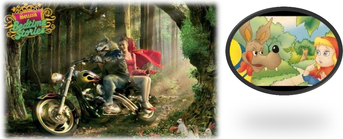
Figura 04 - Peça Contos de Melissa Chapeuzinho Vermelho