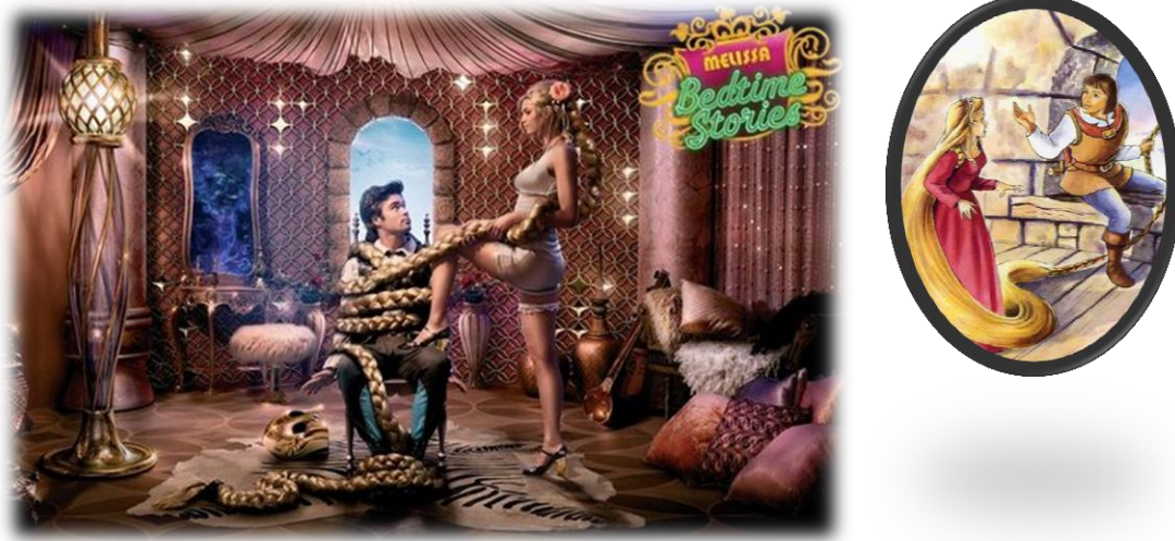
Figura 05 -Peça Contos de Melissa Rapunzel

substituem a imagem masculina do pai pelo namorado. E os anseios de burlar a regras impostas pela figura materna.