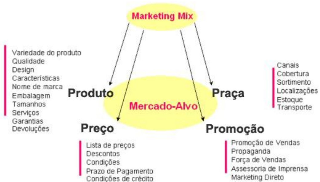
Figura 02 - A estrutura dos quatro P's