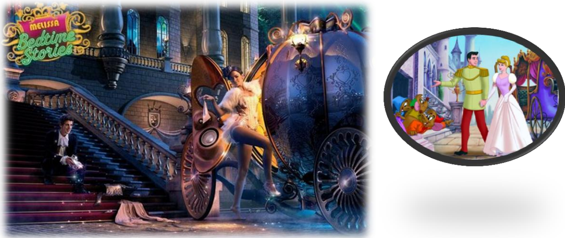
Figura 06 _ Peça Contos de Melissa Cinderela