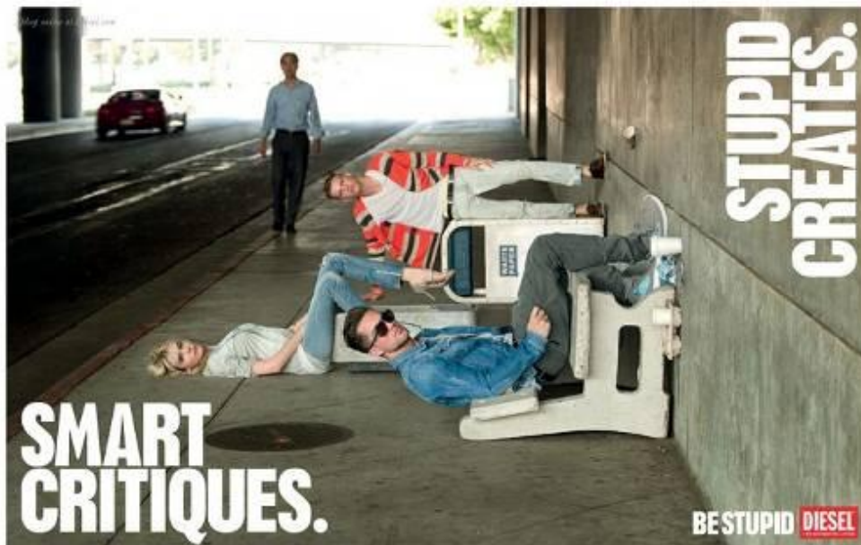
Figura 07 -Peça Diesel – Campanha “Be Stupid”

Assim como balões, estamos cheios de esperanças e sonhos. Ao longo do tempo, porém, uma única frase se arrasta em nossas vidas: não seja estúpido. Trata-se de um triturador de possibilidades. O maior deflator do mundo. O mundo está cheio de pessoas espertas fazendo todo tipo de coisas espertas... Isso é ser esperto. Bem, nós preferimos ser estúpidos. Ser estúpido é incansável busca por uma vida livre de arrependimentos. Espertos podem ter cérebro, mas estúpidos têm coragem. Espertos podem reconhecer as coisas como elas são. Estúpidos veem as coisas como elas poderiam ser. Espertos criticam. Estúpidos criam. O fato é que, se não tivéssemos pensamentos estúpidos, não teríamos pensamentos interessantes. Enquanto os espertos planejam, os estúpidos já têm as histórias. Espertos podem ter autoridade, mas estúpidos têm o inferno de uma ressaca. Arriscar-se não é esperto é estúpido. Ser estúpido é ser corajoso. O estúpido não tem medo de errar. O estúpido sabe que há coisas piores do que o erro – como nem mesmo tentar. Quando um esperto tem uma boa ideia, esta ideia é estúpida. Você não pode ser mais esperto que os estúpidos. Nem sequer tentar. Lembre-se que apenas a estupidez pode ser realmente brilhante. Portanto, Seja Estúpido. (SEJA... Canal do Youtube da Diesel).