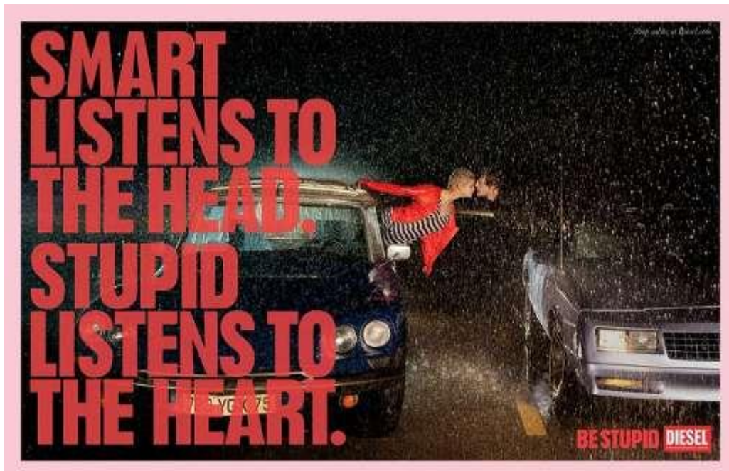
Figura 09- Peça- Campanha da “Be Stupid”

Tradução: Os espertos têm planos, os estúpidos histórias.