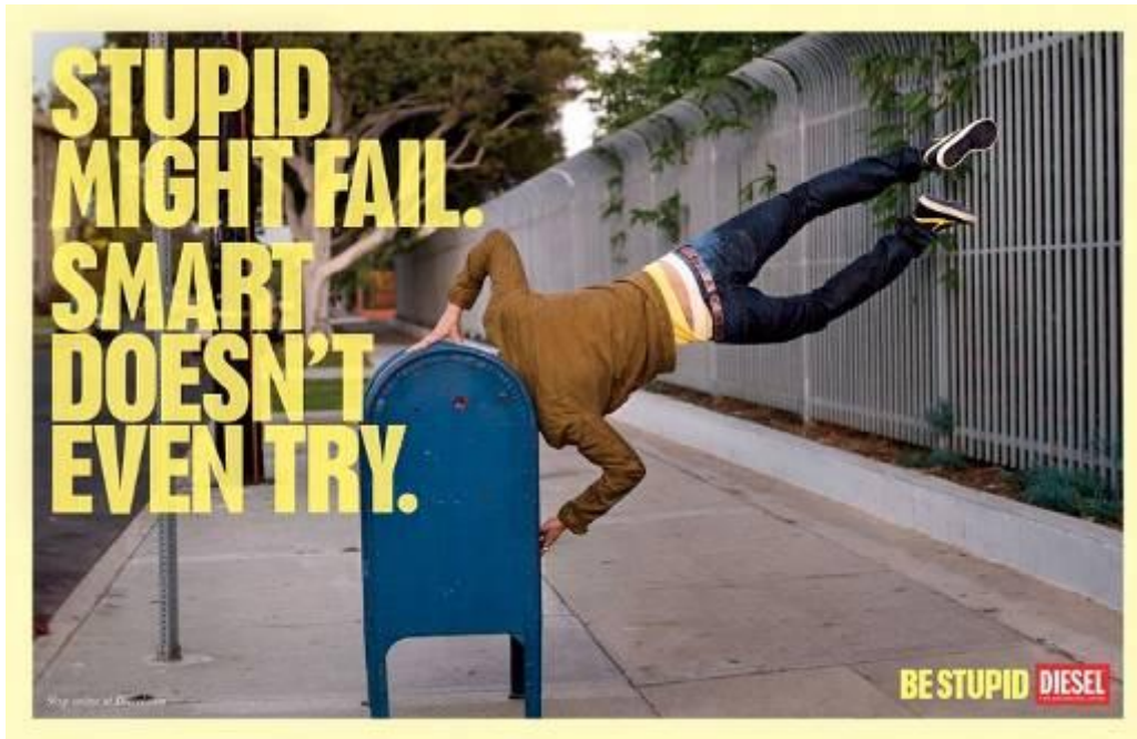
Figura 10 - Peça Campanha “ Be Stupid”