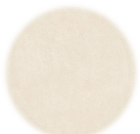
PISO DE CONCRETO BEGE