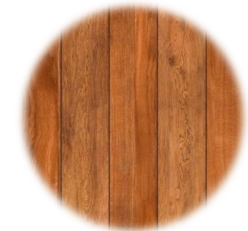
DECK DE MADEIRA