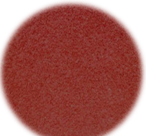
CICLOFAIXA CONCRETO VERMELHO

.\THINGS\TCC bruno\O QUE TA PRONTO\RENDER\000.0008.jpg