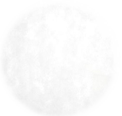
PISO DE CONCRETO BRANCO